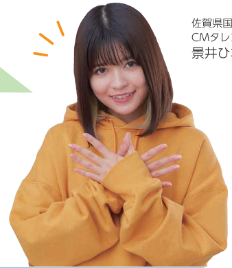
佐賀県国保 CMタレント 景井ひな

国保に加入するときや脱退するときなど、保険証の内容等に変更が生じる場合はお住まいの市町(国保組合)の国保担当窓口へ届け出を必ず行ってください(自動では切り替わりません)。